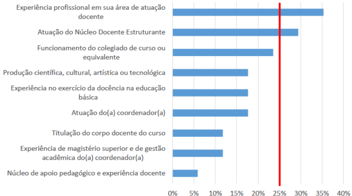
Percentual de Cursos com fragilidades, Dimensão 2, Alegre